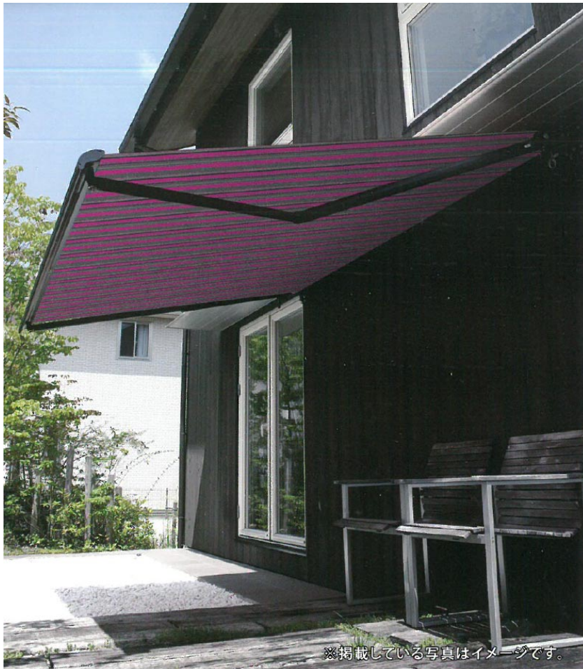
※掲載している写真はイメージです。

You can use the fade resistant and environmentally friendly ECOPET® outdoors worry free. Choose cotton material from an abundance of variations through combinations with multi-color.